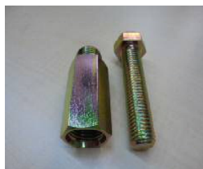
6価有色クロメート