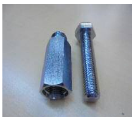
3価光沢クロメート(ユニクロ)