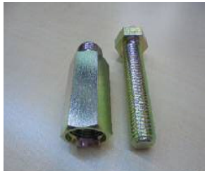
3価クロメート(有色)