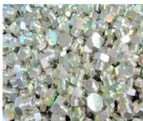
ベーキング(水素脆性)処理