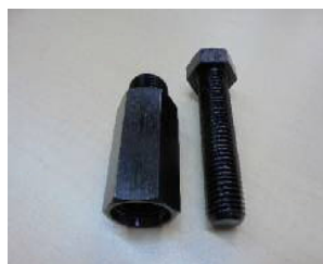
6価黒色クロメート