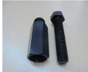
3価黒色クロメート